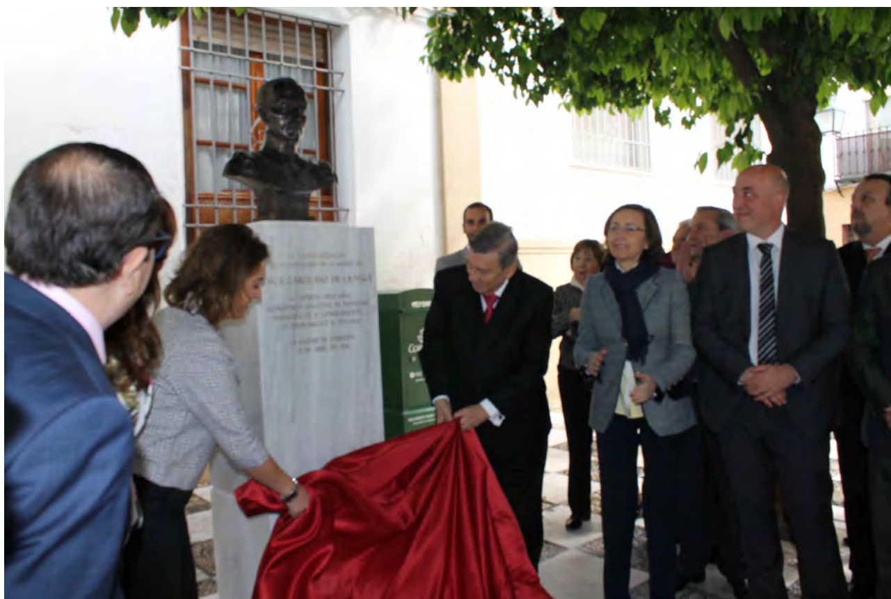
Fig. 2. Inauguración Busto Inca Garcilaso. Plaza del Indiano Córdoba. 23 de abril de 2016.

Unos días más tarde, entre el 27 y el 30 de abril, se desarrolló el Simposio Internacional “El Inca Garcilaso y su proyección en la interculturali-